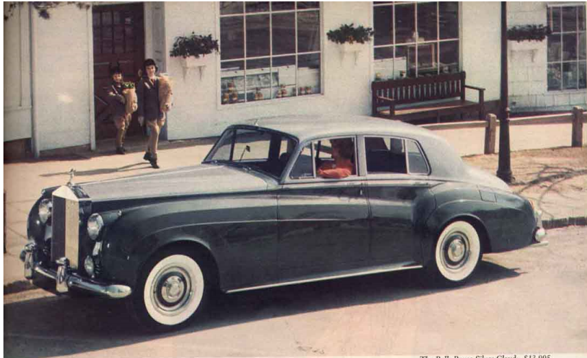
The Rolls-Royce Silver Cloud—$13,995